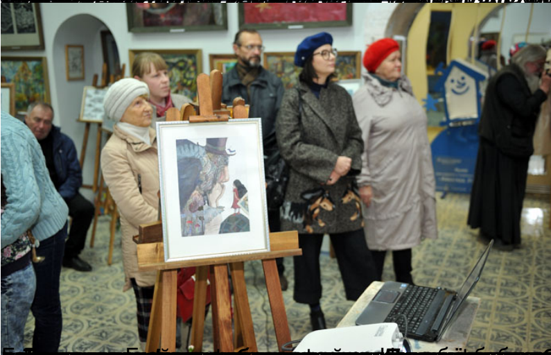
Ю.П.Попов, «Взгляд», 2019 г.